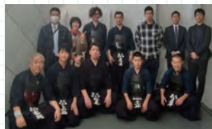
▲ 出場した選手と応援のOB・OG