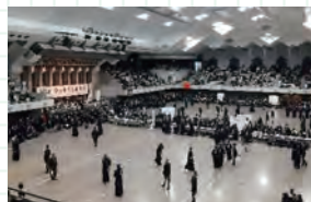
▲ 大会の様子 (於: 東京武道館)

大学の草創期の同窓生から現在まで各世代が、母校の名のもとに協力し合えるのは大変素晴らしいことだと思います。同窓会と駿大剣友会が共に益々発展することを切に願ひ、簡単ですが私たちの活動の一部を紹介させていただきました。